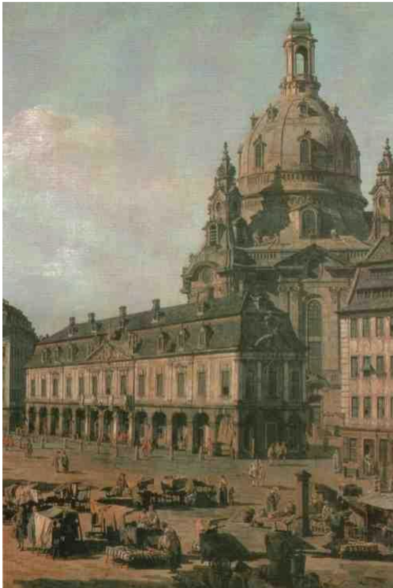
„Der Neumarkt zu Dresden von der Moritzstraße aus“ (Ausschnitt aus Canalettos Gemälde)

„Endlich eröffnete sich die Dresdner Gegend, in dem reichen Lande der im Morgenlicht glänzende Strom, daran die im Dufte schimmernde Stadt mit ihren Türmen ...“ (Ernst Rietschel, 1804 – 1861)